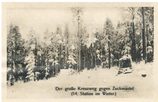
Obr.3 Čtrnácté zastavení křížové cesty od Zlatých Hor