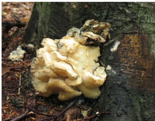
Obr.6 Ježatec různozubý

Literatura: Hagara Ladislav, Atlas hub , Martin 1993, s.104-105.