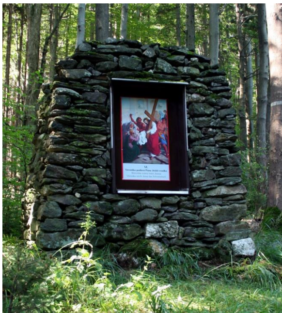
Obr.5 Šesté zastavení s novou reprodukcí obrazu

v Evropě, tak na dalších kontinentech. Na internetových stránkách vídeňského kostela ( www.pfarre-nepomuk.at ), si farnost vede statistiku, v kolika zemích a kostelích byla využita. Musím ale podotknout, že jejich evidence není zdaleka úplná, neboť jenom v našem pohraničí je celá řada kostelů s těmito kopie-mi Führichova díla.