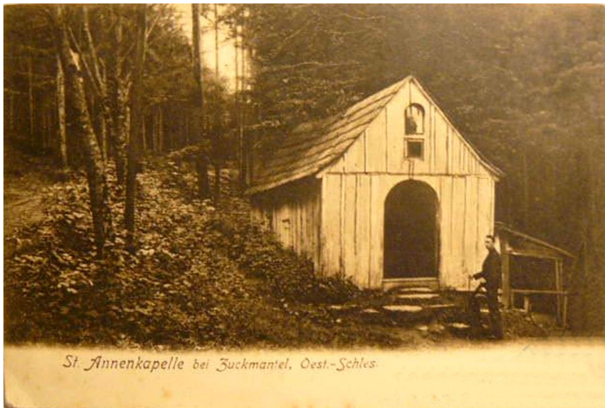
Obr.1 Kaple sv. Anny u hradu Edelštejna před rokem 1905.