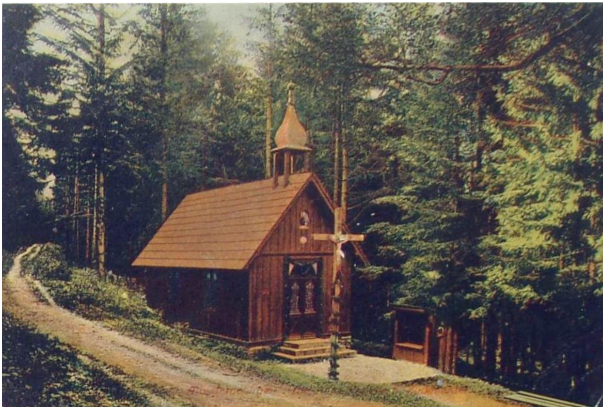
Obr.2 Kaple sv. Anny po roce 1905